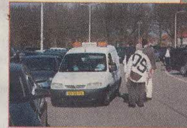
De parkeercontroleurs geven het op