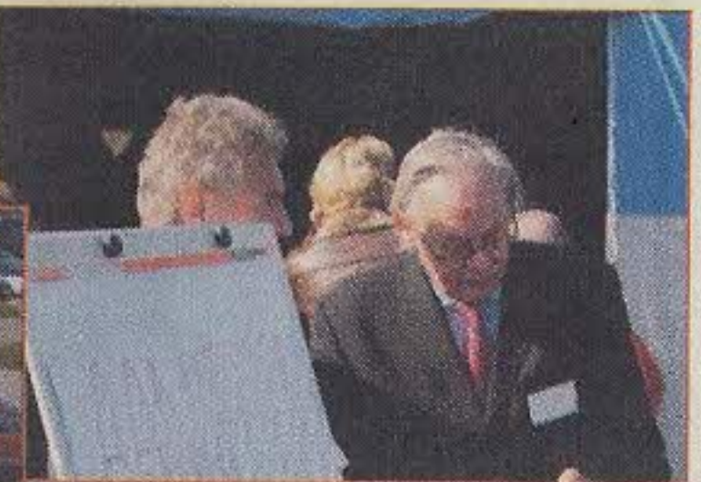
De organisator "ik weet niet hoe die ambassadeur er uitziet"