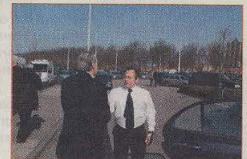
He, weer een ambassadeur!