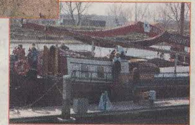
Met z'n allen het schip in