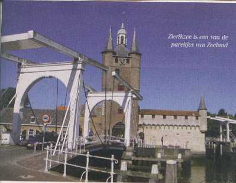
Zierikzee is een van de pareltjes van Zeeland