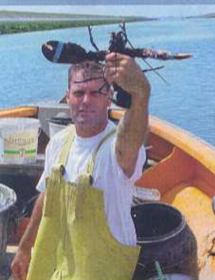
Het seizoen van de Oosterscheldekreëft loopt van 1 april tot 15 juli.