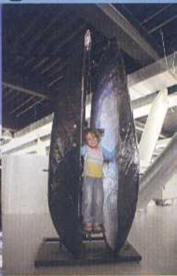
In Deltapark Neeltje Jans is een permanente mosselexpositie.

De opening van het kreeftenseizoen, dat traditiegetrouw plaats vindt in Zierikzee op de laatste donderdag van maart, werd dit jaar overschaduwd door een actie van de Zeeuwse mosselkwekers die zich ernstig zorgen maken over hun toekomst. Een flink deel van het mosselzaad wordt opgevisst uit de Waddenzee en naar de mosselpercelen in de Oosterschelde gebracht. De Raad van State heeft dat nu verboden. Volgens milieuorganisaties zou dat namelijk schadelijk zijn voor het natuurlijke evenwicht in de Waddenzee. Maar zonder zaad ook geen mosselen meer, en die zijn toch een van de bekendste Zeeuwse producten. De Minister van Landbouw, Gerda Verburgh, belooft alvast aan een oplossing te werken. Wordt dus vervolgd.