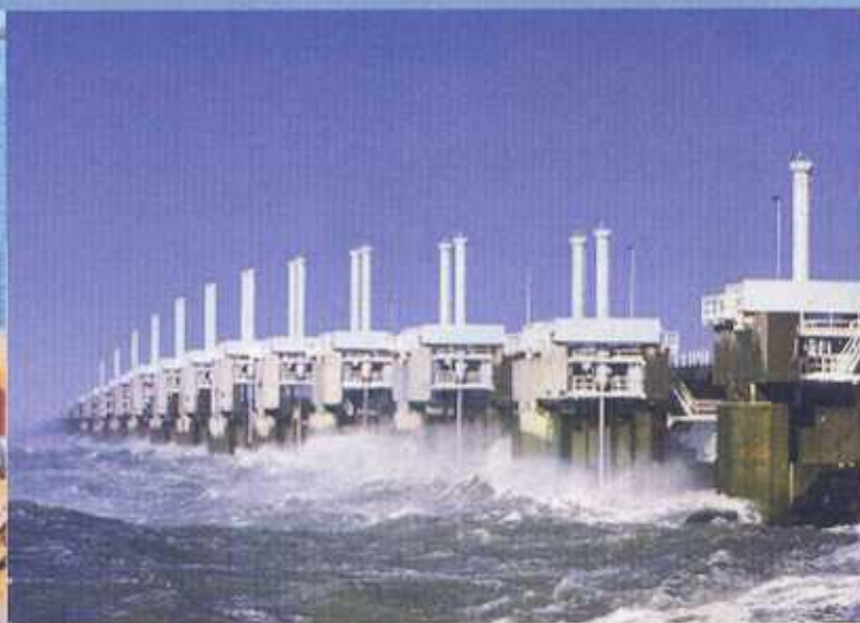
Een bezoek aan de stormvloedkering is een must.