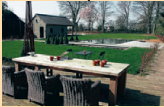
■ Bij mooi weer kan je genieten van de zwembad en de petanquebaan in de grote tuin.