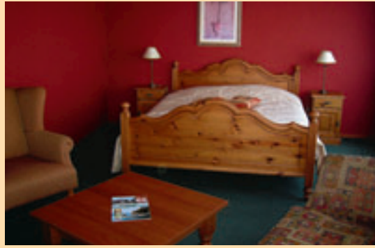
■ De kamers zijn in countrystijl ingericht en ze hebben een zithoek.

Zeeuws-Vlaanderen is echt niet ver, de toltunnel onder de Westerschelde heeft de afstand tot bij onze noorderburen nog kleiner gemaakt. Op het eiland Schouwen-Duiveland kan je alle seizoenen gaan uitwaaien in de duinen of heerlijke fietstochten maken op rustige wegen. Een goede uitvalsbasis hiervoor is Duinhotel Haamstede in Burgh-Haamstede.