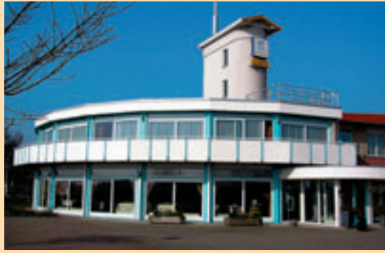
■ Het hotel ligt op een boogschuit van allerlei Zeeuws attracties.