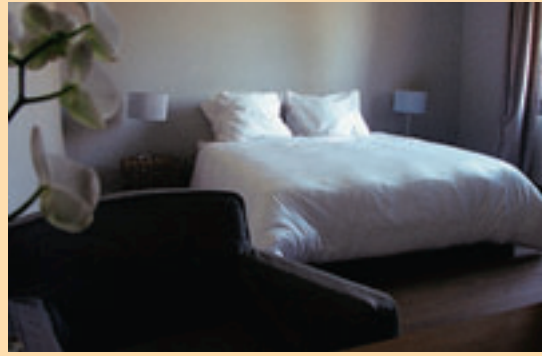
■ De kamers zijn voorzien van dvd, flatscreen-tv én de dvd-collectie 'Fawlty Towers'.

Op het pittoreske kerkplein van Leut, dat ooit als decor diende voor de tv-serie 'De Partizanen', werd onlangs een nieuwe bed & breakfast geopend. B & B Basil, midden in het groene Maasland, is omringd door oergezellige Maasdorpijjes en ligt op een boogschuit van de cultuursteden Maaseik en Maastricht en de shoppingparadijsjes Maasmechelen Village en Winkelcentrum M2.